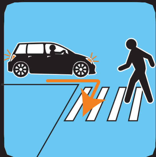
ነተን ዝዕጸፋ መካይን ትኹረት ሂብካ ረኣ