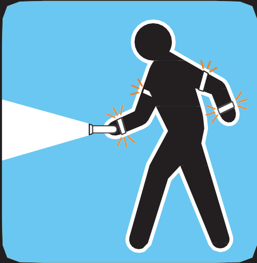
አብ ምሸት ድሙቕ ኩን