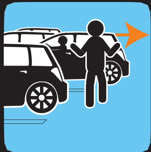
አብ ናይ መካይን ጠጠው መበሊ ጥንቓቕ ግበር