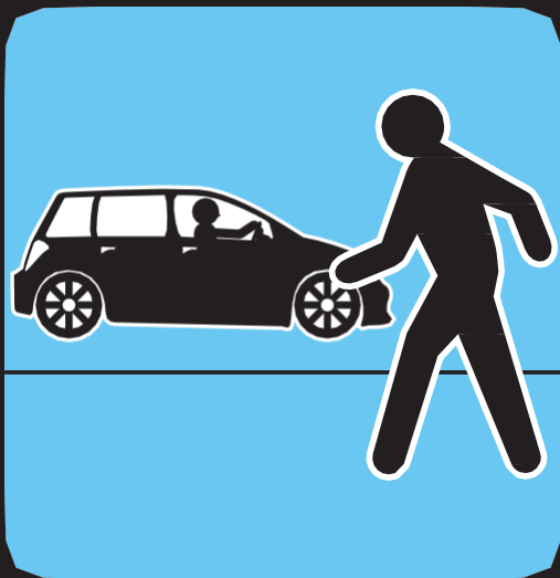
ገጽካ ናብ`ቲ ናይ ተሸከርከርቲ ፍሰት ጌርካ ተሳገር