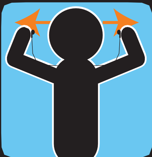
ነቲ መወተፊ ኣውጺእኻ ትኹረት ግበር