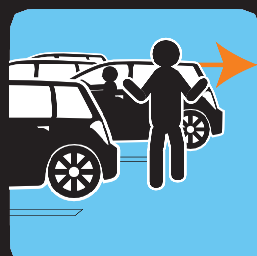
ယာဉ်ရပ်နားရာ နေရာများတွင် သတိထားပါ