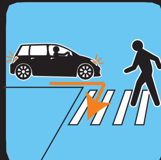
ကွေ့လာသော ကားများကို သတိထားပါ