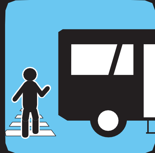
ဘတ်စ်ကားပေါ်မှ ဆင်းသည့်အခါ ဘေးကင်းစွာ လမ်းကူးပါ